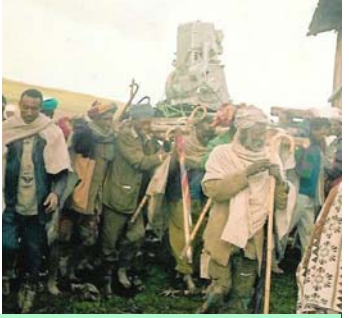
የአካባቢው ምዕመናን ወፍጮውን ወደ ገዳሙ ሲያዙ