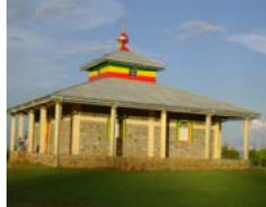
የቦረዳ ገዳም ዮርዳኖስ ቅድስት ሥላሴ ቤ/ክ

ማኅበረ ቅዱሳን የማኅበራዊ አገልግሎት እና ልማት ዋና ክፍል የቅዱሳን መካናት ልማትና ተራድያ ክፍል አድራሻ: ስልክ: 251 11 1234531፣ 0911150478 ፖ.ሳ.ቁ. 80078 ኢ.አ ኢትዮጵያ